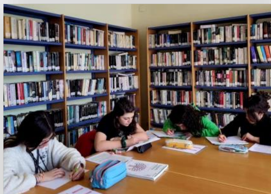
Continúan los cursos de técnicas de estudio.