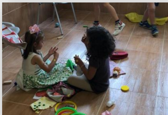
Los más jóvenes disfrutan de las actividades de “Sancris Joven”.