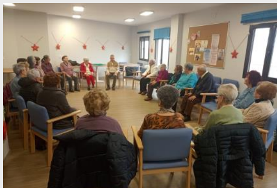
El Centro de Mayores “Virgen del Rosario” celebra su primer aniversario.