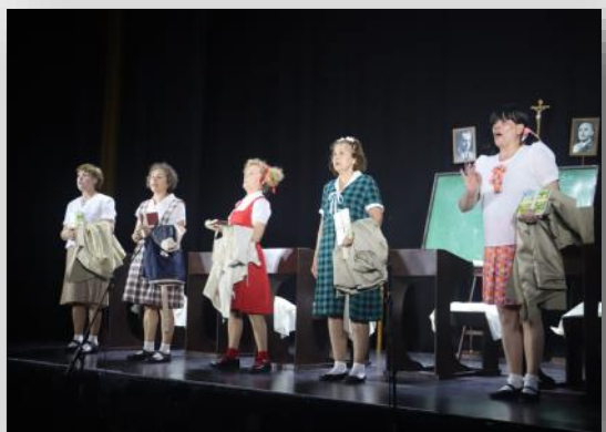
Teatro Candilejas y su obra “A las niñas pláticas y ejemplos”, cuya recaudación se destinará a otra actuación teatral.