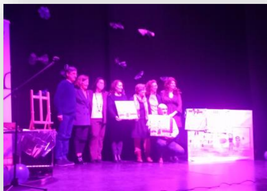
San Cristóbal de Segovia celebra el 8M.