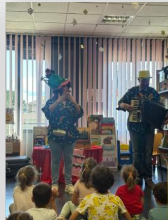
Actuación del Sombrero de la Memoria en la Biblioteca