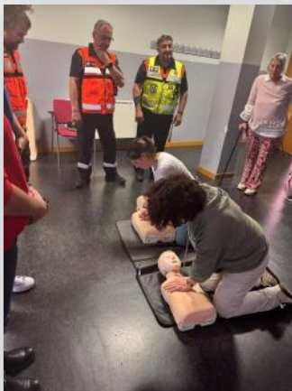
Curso primeros auxilios