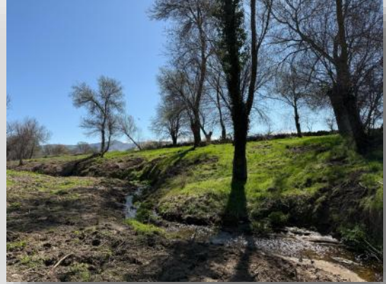
Limpieza y mejora de los cauces de los arroyos en los espacios municipales.