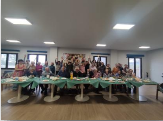
Celebración del segundo aniversario del centro de mayores Virgen del Rosario