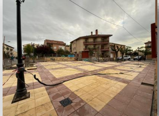
Mejora de la plaza Angelines Ballesteros